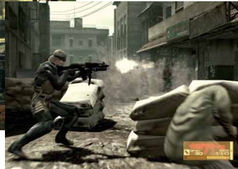
Metal Gear Solid