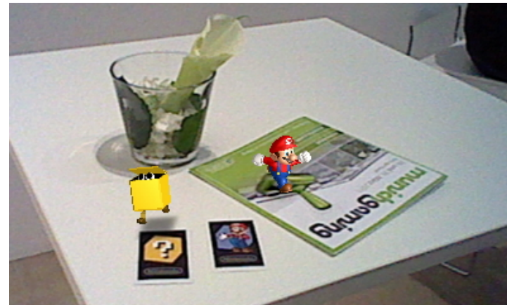
2D Image of Nintendo 3DS game